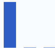
Фактическая совокупная фискальная нагрузка, %